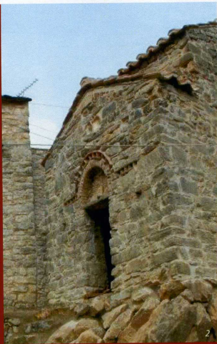
Φωτό. 1 & 2: Η Δυτική πρόσοψη του ναού πριν και μετά τις εργασίες αποκατάστασης.

Ο Άγιος Νικόλαος «στης Μαρούλαινας» είναι ένας από τους μικρότερους σταυρεπίστεγους ναούς της Πελοποννήσου. Κτίστηκε λίγο μετά τα μέσα του 13ου αιώνα χωρίς ιδιαίτερη εκζήτηση, με μικρούς λίθους, συνδετικό ασβεστοκονίαμα και μικρά τεμάχια πλίνθων στους αρμούς.