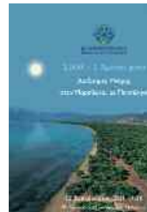
Η αφίσα της εκδήλωσης