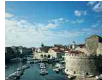
Το λιμάνι του Dubronnik

Αυτή η εξαιρετική εκδρομή μας έδωσε την ευκαιρία σε 5 μόλις ημέρες να γνωρίσουμε το μεγαλύτερο μέρος της τόσο κοντινής κι όμως τόσο λίγο γνωστής Δυτικής Βαλκανικής, να διαπιστώσουμε την ιστορική συνέχεια της περιο-