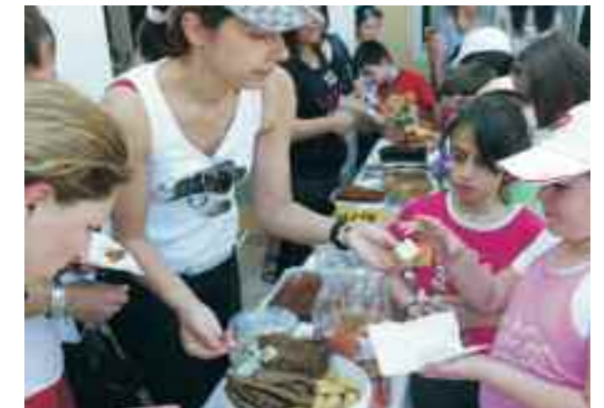
Δράση διαγωνισμού: Παράθεση υγιεινού πρωινού

Το Βραβείο Αειφόρου Σχολείου: ένα απολύτως καινοτόμο πρόγραμμα