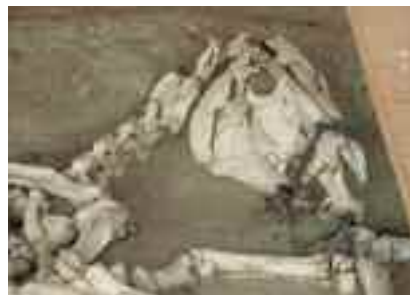
Από την ανασκαφή της Μικρής Δοξίπαρας-Ζώνης