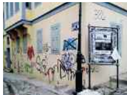
Το κτίριο ΠΙΡΙΝ με μουτζουρωμένες τις όψεις του

Την Κυριακή 5 Ιουνίου, με αφορμή τον εορτασμό της παγκόσμιας Ημέρας Περιβάλλοντος, η Διοικούσα Επιτροπή και τα μέλη του Παραρτήματος Θεσσαλονίκης της Ελληνικής Εταιρείας επιλέξαμε να οργανώσουμε εκδήλωση στα γραφεία μας με ένα συμβολικό τρόπο. Καθαρίσαμε τους βανδαλισμένους εξωτερικούς τοίχους του διατηρητέου κτιρίου των γραφείων μας στην Άνω Πόλη και φυτέψαμε λουλούδια στην αυλή του προσπαθώντας να δείξουμε στους περιοίκους της γειτονιάς και στους επισκέπτες της περιοχής την άποψή μας για τον πολιτισμό, το περιβάλλον και την δική μας ευθύνη και συμμετοχή. Και επειδή οι συμμετοχικές εκδηλώσεις για εμάς είναι πάντα γιορτή, καταλήξαμε σε ένα