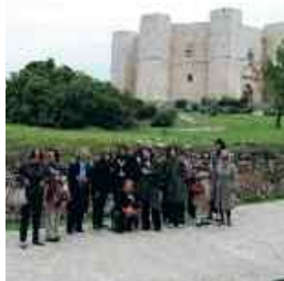
Castel del Monte στην Απουλία

Για το 2012 προγραμματίζονται επισκέψεις στον ελλαδικό χώρο όπου η ΕΛΜΕΤ έχει επιτελέσει και εξακολουθεί να επιτελεί αναστηλωτικό έργο, σε παραδοσιακούς οικισμούς, όπως στα Ζαγοροχώρια, Πήλιο, Πάτμο κτλ. Θα εντάξουμε επίσης και πόλεις στην Ευρώπη με ισχυρή παρουσία της ελληνικής τέχνης και ιστορίας, όπως το Μόναχο και τη Βιέννη. Αξίζει να σημειωθεί ότι οι εξορμήσεις αυτές θα ενταχθούν στον εορτασμό των 40 ετών λειτουργίας της ΕΛΜΕΤ.