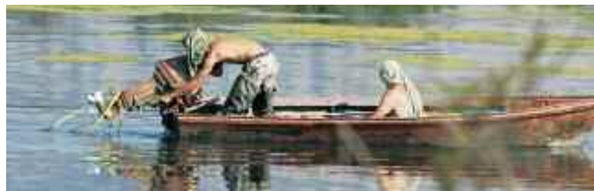
Κουκουλοφόροι λαθροθήρες. / Φωτό: Φορέας Διαχείρισης Εθνικού Πάρκου Υγροτόπων Αμβρακικού - ΦΔ ΕΠΥΑ

Με αφορμή την παράτυπη απόφαση της Αποκεντρωμένης Διοίκησης Ηπείρου-Δυτικής Μακεδονίας (απόφαση της Γενικής Γραμματέως κας Γεωργακοπούλου-Μπάστα) στο Εθνικό Πάρκο Υγροτόπων Αμβρακικού (ΕΠΥΑ), τον Σεπτέμβριο 2011, για την κατάργηση της απαγόρευσης θήρας, οι 10 ΜΚΟ, υπό τον συντονισμό της ΕΛΛΗΝΙΚΗ ΕΤΑΙΡΕΙΑΣ και της Ορνιθολογικής που εκπροσωπούν τις λοιπές ΜΚΟ στο Διοικητικό Συμβούλιο (ΔΣ) του Φορέα Διαχείρισης (ΦΔ) ΕΠΥΑ, πίεσαν συστηματικά με την σειρά τους, με αλληπάλληλες επιστολές και τηλεφωνική επικοινωνία με το ΥΠΕΚΑ (Υπουργό, Γ. Παπακωνσταντίνου και Ειδικό Γραμματέα Δασών, Γ. Αμοργιανιώτη) και δημοσιοποίησαν στα ΜΜΕ, για την ανάκληση της απόφασης. Ήδη εδώ και μερικές εβδομάδες σημειώθηκαν προκλητικά κρούσματα λαθροθηρίας στην περιοχή, η άσκηση της οποίας γίνεται εκτός «κανονικού» ωραρίου των υπηρεσιών, είναι παντός καιρού και πραγματοποιείται με ανορθόδοξα μέσα. Η απόφαση της Γ.Γ. κρίθηκε παράτυπη, αλλά και επί της ουσίας παράνομη για τους εξής λόγους: