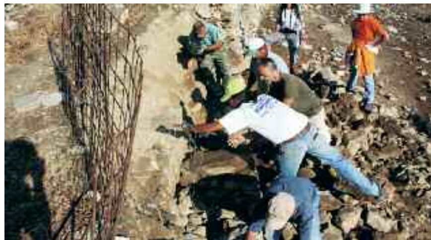
Εθελοντές και ντόπιοι μαστόροι αναστηλώνουν την πεσμένη Ξερολιθιά