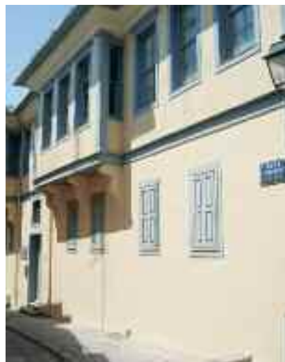
Το κτίριο ΜΕΤΑ

μεγάλο τραπέζι με φαγητά και γλυκά που έφερε ο καθένας μας και άφθονο κρασί που είχε την καλοσύνη να μας προσφέρει το μέλος και Δήμαρχός μας κ. Γιάννης Μπουτάρης.