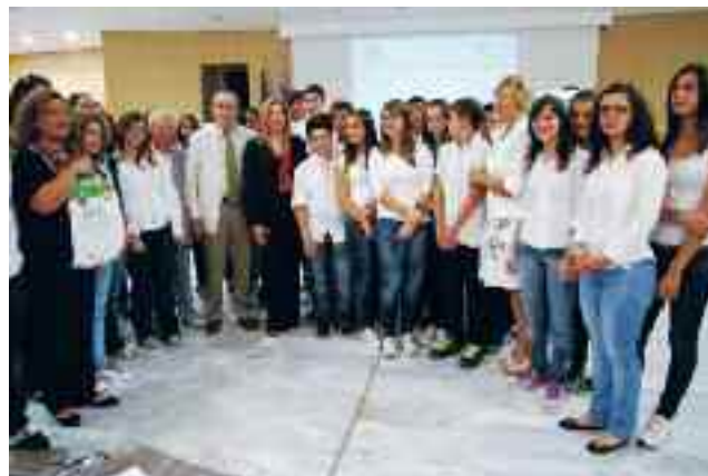
Η κα Φώφη Γεννηματά, Αναπληρώτρια Υπουργός Παιδείας, Δια Βίου Μάθησης & Θρησκευμάτων και ο κ. Γιάννης Μιχαήλ, Πρόεδρος της ΕΛΛΗΝΙΚΗΣ ΕΤΑΙΡΕΙΑΣ Περιβάλλοντος & Πολιτισμού (αριστερά), με δασκάλους και μαθητές των σχολείων που διακρίθηκαν στο «Βραβείο Αειφόρου Σχολείου»