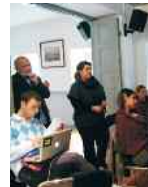
Συμμετέχοντες στο σεμινάριο

Το Ευρωπαϊκό Γραφείο Περιβάλλοντος (ΕΕΒ) και τα μέλη του: Ελληνική Εταιρεία Περιβάλλοντος και Πολιτισμού και Δίκτυο ΜΕΣΟΓΕΙΟΣ SOS, σε συνεργασία με την Οικολογική Εταιρεία Ανακύκλωσης, διοργάνωσαν διήμερο σεμινάριο με θεματικό άξονα το επίκαιρο και πάντα κρίσιμο ζήτημα της διαχείρισης των απορριμμάτων, την Πέμπτη 3 και την Παρασκευή 4 Νοεμβρίου, στα γραφεία της ΕΛΜΕΤ, Τριπόδων 28 στην Πλάκα.