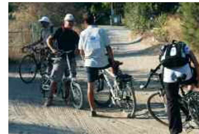
Συμμετέχοντες στην Ποδηλατική Διαδρομή

Στις 12 Σεπτεμβρίου 2011, 2500 + 1 χρόνια μετά τη Μάχη του Μαραθώνα και 1 χρόνο μετά τη σημαντική εκδήλωση μνήμης στον Τύμβο, η ΕΛΛΗΝΙΚΗ ΕΤΑΙΡΕΙΑ Περιβάλλοντος & Πολιτισμού, τηρώντας τη δέσμευσή της για συνεχή φροντίδα του ιστορικού χώρου, κάλεσε το ευρύ κοινό να γνωρίσει τη φύση και την ιστορία στον Μαραθώνα, σε συνεργασία με το Δήμο Μαραθώνος και το Φορέα Διαχείρισης Εθνικού Πάρκου Σχινιά-Μαραθώνα, με την υποστήριξη του Ιδρύματος Α.Γ. Λεβέντη και τη συμβολή διακεκριμένων επιστημόνων, αρχαιολόγων και μελετητών της ελληνικής χλωρίδας.