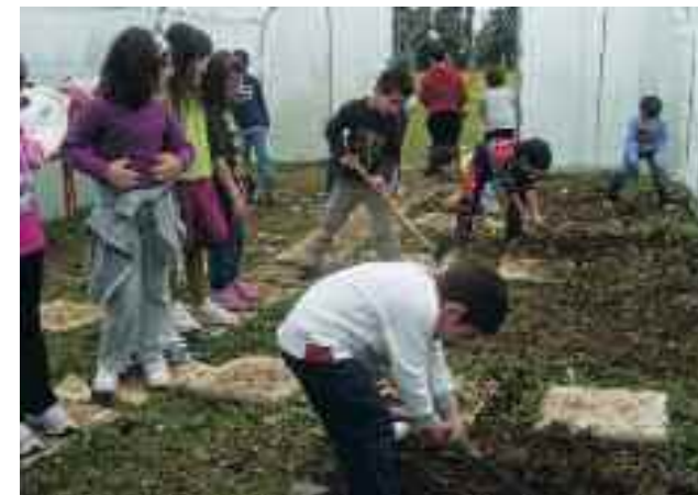
Δράση διαγωνισμού: 2ο Δ.Σ. Ν. Ραιδεστού

και Τεχνολογικού Εκπαιδευτικού Ιδρύματος Ηπείρου και με την ευγενική χορηγία της WIND και του Ιδρύματος Μποδοσάκη. Στη διάρκεια της περσινής σχολικής χρονιάς μαθητές 140 σχολείων απ' όλη τη χώρα – 22 Λυκείων, 51 Γυμνασίων, 54 Δημοτικών, 10 Νηπιαγωγείων και Ειδικών Σχολείων – με ομαδική δουλειά και ιδιαίτερη αφοσίωση κατάφεραν να ενσωματώσουν στην εκπαιδευτική διαδικασία μια σειρά από περιβαλλοντικές δράσεις και καλές παιδαγωγικές πρακτικές: ανακύκλωση, καθαρισμούς παραλίας, παράθεση υγιεινού πρωινού κ.α. Τα πρώτα συμπεράσματα είναι κάτι παραπάνω από ενθαρρυντικά: Το 85% των σχολείων δήλωσε ότι θα συμμετέχουν και φέτος στο διαγωνισμό, ενώ κανένα δεν δήλωσε αρνητική πρόθεση. Όλα τα σχολεία δήλωσαν ότι θα συνεχίσουν τις καλές πρακτικές που ανέπτυξαν στο πλαίσιο του διαγωνισμού, ανεξάρτητα αν αυτός συνεχιστεί ή όχι. Το 80% των εκπαιδευτικών δήλω-