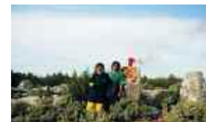
Αναβίωση των Φрукτωριών - άναμμα του «Πύργου της Μαύρης Σπηλιάς»

• Ο Σεπτέμβρης όμως δεν τελείωσε εκεί! Με πρωτοβουλία του Συμβουλίου Επικοινωνίας της ΕΛΜΕΤ, τη στήριξη του προγράμματος ΑΕΙΦΟΡΟ ΑΙΓΑΙΟ και τη συνεργασία ντόπιων μαστόρων της πέτρας αλλά και εθελοντών, αποκαταστάθηκε μέρος των πεσμένων ξερολιθιών στο