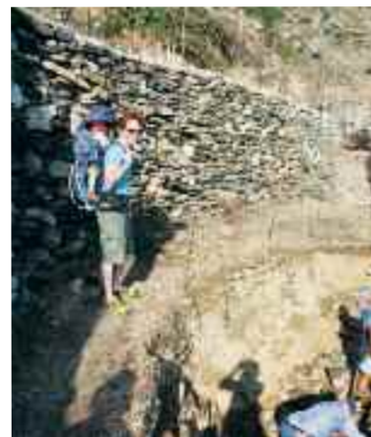
Η παλιά τεχνική εντυπωσιάζει τους επισκέπτες

Τον περασμένο Σεπτέμβριο ξεκίνησε η σηματοδότηση, το καθάρισμα και γενική φροντίδα 5 βασικών πεζοπορικών διαδρομών της Σίφνου, στα πλαίσια του προγράμματος «Μονοπάτια Πολιτισμού» της ΕΛΛΗΝΙΚΗΣ ΕΤΑΙΡΕΙΑΣ, που φιλοδοξεί να προστατεύσει, να συντηρήσει και να αναδείξει μονοπάτια σε μέρη της Ελλάδας με ιδιαίτερο ιστορικό και περιβαλλοντικό ενδιαφέρον. Στη Σίφνο το πρόγραμμα υλοποιείται σε συνεργασία με τον Δήμο και την εταιρεία Terrain.