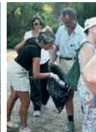
Συμβολικός καθαρισμός του δάσους της κουκουναριάς από εθελοντές