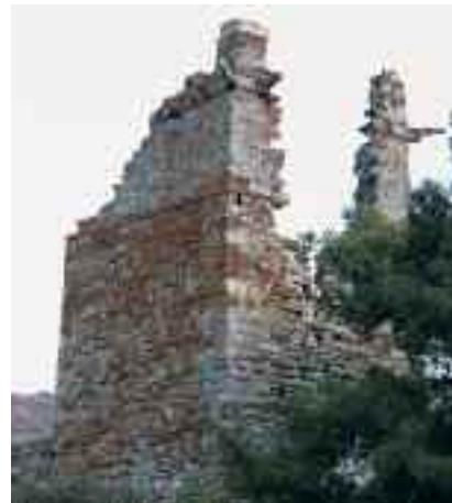
Ο Πύργος της Κέας πριν και μετά τις εργασίες στήριξης

Με επίμονες προσπάθειες του Συμβουλίου Αρχιτεκτονικής Κληρονομιάς της ΕΛΜΕΤ άνοιξε ο δρόμος για την αποκατάσταση του αρχαίου πύργου στην Αγία Μαρίνα Κέας. Ο εντυπωσιακός πύργος του 4ου π.Χ. αιώνας, με διαστάσεις πλευράς 9,90 μ. και ύψος 19,55 μ., είναι μνημείο μοναδικής αξίας, δεδομένου ότι αποτελεί το καλύτερο σωζόμενο παράδειγμα αυτόνομου ελεύθερου τετράγωνου πύργου της υστεροκλασσικής περιόδου, ενώ η θέση του, στο κέντρο μιας καλλιεργήσιμης κοιλάδας, του προσδίδει και έναν αγροτικό χαρακτήρα. Μέχρι τα μέσα του 19ου αι. το μνημείο σωζόταν ακέραιο, λόγω της ενσωμάτωσής του στον περίβολο της παρακείμενης μεταβυζαντινής μονής της Αγίας Μαρίας. Ακόμα και σήμερα, σε ορισμένα σημεία ο πύργος σώζεται σχεδόν μέχρι το αρχικό του ύψος, όμως κατά τα τελευταία χρόνια τμήματά του κατέρρεαν. Με πρωτοβουλία της ΕΛΜΕΤ και με την συγκι-