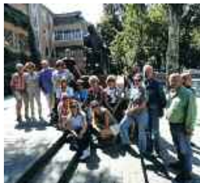
Μέλη & φίλοι της ΕΛΜΕΤ μπροστά στο άγαλμα του μεγάλου ευεργέτη Γ. Μαρασλή στην Οδησό