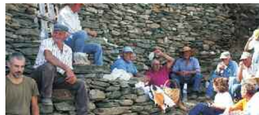
Ένα σύντομο διάλειμμα για την ομάδα της ΕΛΜΕΤ

Μας θύμισαν πόση σημασία έχει η εικόνα μας προς τα έξω, μετά από όσα έχουν συμβεί και γραφτεί για μας τον τελευταίο καιρό, και πόσο τέτοιες ενέργειες μαρτυρούν μια Ελλάδα που είναι ακόμα άρατη προς τα έξω, αλλά στο χέρι μας να αναδείξουμε ως αντιπροσωπευτική του δυναμικού μας.