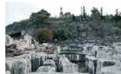
Αρχαιολογικός χώρος Ελευσίνας