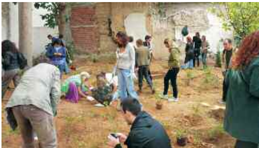
Όλες οι ηλικίες συμμετέχουν.

Ο φίλος που με συνόδευσε τρόμαξε βλέποντας τους ναρκομανείς. «Δεν σ' αφήνω εδώ» είπε, «είναι επικίνδυνα». Φθάνοντας στον πρώτο ελεύθερο χώρο ένοιωσα ανακούφιση. Κόσμος πολύς, όλοι εθελοντές κάθε ηλικίας, κυρίως κάτοικοι. Τα παιδιά ενθουσιασμένα έσκαβαν, έριχναν χώμα, τοποθετούσαν με λίγη βοήθεια τα μικρά δενδράκια (προσφορά της εταιρείας ΟΙΚΟΣΤΕΓΕΣ). Φύτευαν, όχι τυχαία αλλά σε σχέδιο του διακεκριμένου νέου αρχιτέκτονα τοπίου Θωμά Δοξιάδη που προσέφερε κι αυτός τη δουλειά του.