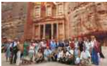
Μέλη και Φίλοι της ΕΛΜΕΤ στην Πέτρα, στο Θησαυροφυλάκιο.

Η Γέρασα, μοναδικό αντιπροσωπευτικό δείγμα του ρωμαϊκού πολιτισμού, σώζεται σχεδόν αυτούσια, με τους ρωμαϊκούς δρόμους, τις κολώνες, θέατρα, ναούς, το φόρουμ, την αψίδα θριάμβου του Αδριανού κ.λπ. Η Πέτρα, πρωτεύουσα των Ναβατταίων, ήταν πέρασμα του δρόμου του μεταξίου μέχρι την