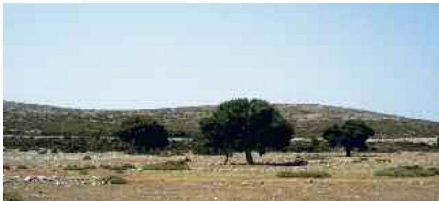
Φωτογραφία: Δάφνης Μαυρογεώργου