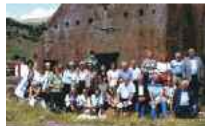
Μέλη και Φίλοι της ΕΛΜΕΤ μπροστά στην Κόκκινη Εκκλησία – μνημείο του 6ου αιώνα

Η Γέρασα, μοναδικό αντιπροσωπευτικό δείγμα του ρωμαϊκού πολιτισμού, σώζεται σχεδόν αυτούσια, με τους ρωμαϊκούς δρόμους, τις κολώνες, θέατρα, ναούς, το φόρουμ, την αψίδα θριάμβου του Αδριανού κ.λπ. Η Πέτρα, πρωτεύουσα των Ναβατταίων, ήταν πέρασμα του δρόμου του μεταξίου μέχρι την