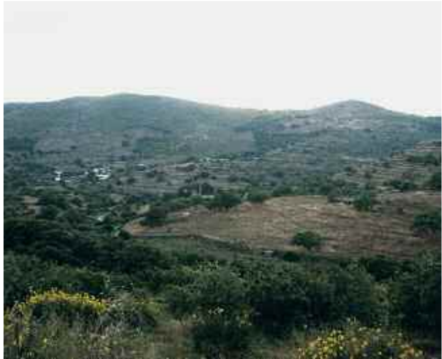
Φωτογραφία: 22.05.2010: Ο πύργος της Αγίας Μαρίας στην Κέα, μετά την πρόσφατη κατάρρευση τμήματός του και το ευρύτερο περιβάλλον.

Παράλληλα, προσβλέπει στην ευαισθητοποίηση και την ενεργητική συμμετοχή του κοινού σε όλες τις παραπάνω διαδικασίες. Το πρόγραμμα αποτελείται από δυο